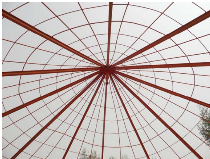
Charpente métallique de la case à palabre