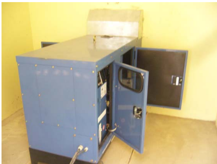
Le groupe de 12 kVA dans son local