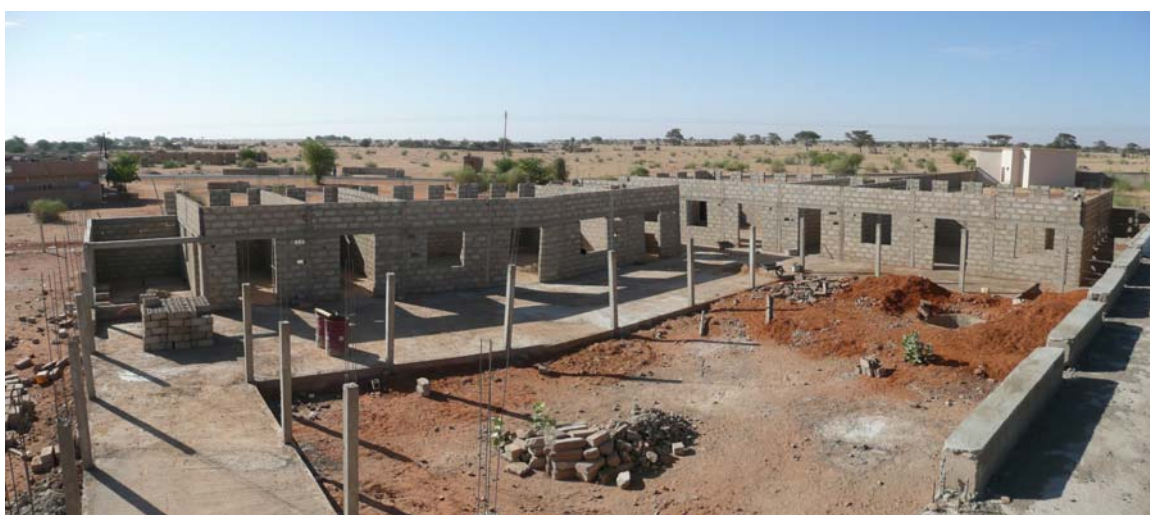
La maternelle en construction - mars 2010

Enfin, après ces modifications du programme, et dans un souci de réduction des coûts globaux, nous avons choisi de réaliser la totalité du gros œuvre d'un seul tenant et de terminer, dans le cadre des financements 2009, une salle de classe, les sanitaires et la cuisine pour la rentrée 2010 (Phase I). Les deux autres salles de classe, le bureau, la salle de repos et toutes les finitions feront l'objet de la seconde phase (Phase II) sur des financements 2010.