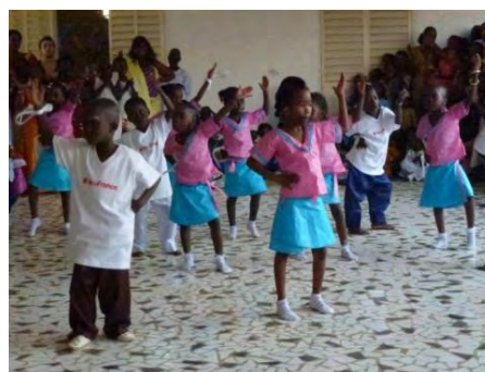
Spectacle de danse des enfants de l'école maternelle