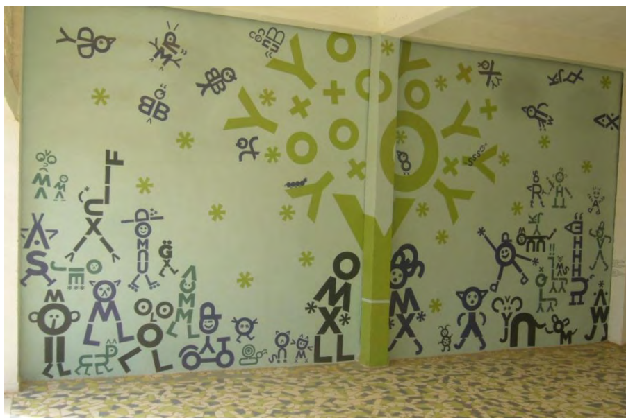
Fresque réalisée sur le mur extérieur de la bibliothèque

élémentaire et maternelle Célestin Freinet : un concours de lecture et une kermesse. Les collégiens organisent également en juin un voyage culturel pour découvrir l'île de Gorée et la Maison des esclaves. Ils nous ont sollicités pour contribuer au financement de leur projet et leur avons proposé de participer et d'ajouter la visite du musée des femmes.