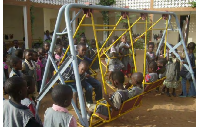
Correspondance des enfants de l'école maternelle