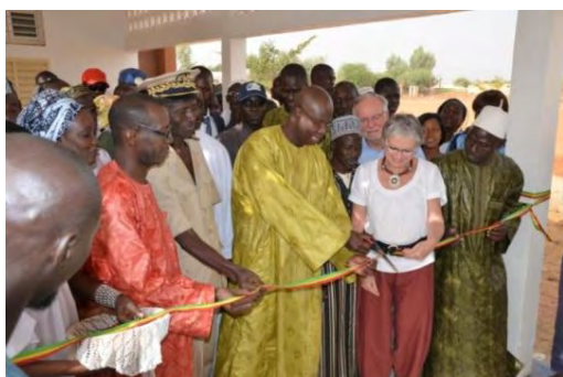
Inauguration officielle en présence du Ministre de l'éducation Nationale

Dimanche place à l'inauguration officielle en présence du Ministre de l'éducation nationale Monsieur Kalidou Diallo : visite des locaux, coupure du ruban, discours des représentants de chaque institution. A tous, nous voulons dire combien nous avons été touchés par l'énorme travail qui a été accompli par les enfants, leurs enseignants, les anciens élèves et les parents d'élèves.