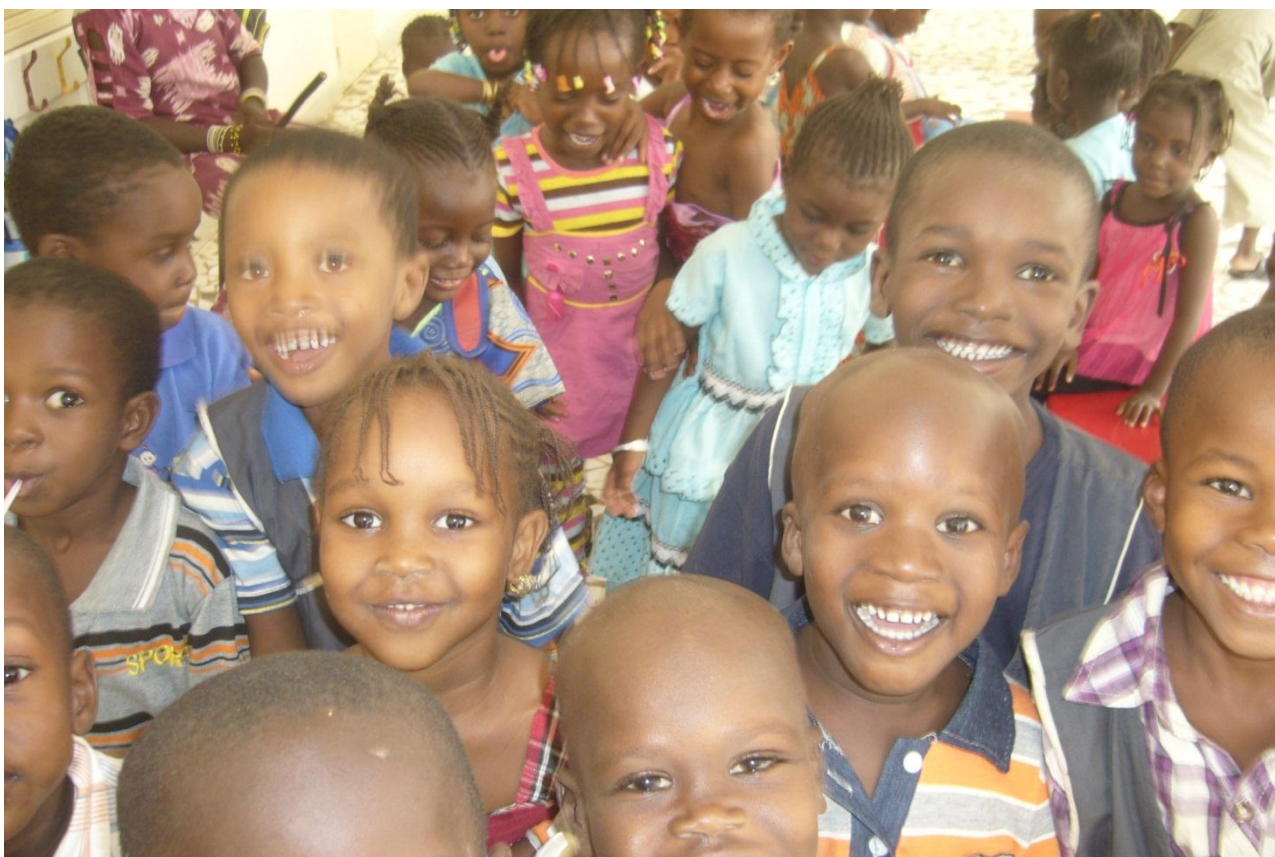
Rentrée 2011-2012 en maternelle

Il reste à concevoir et financer la salle polyvalente et ses annexes, élément structurant permettant le lien entre le centre Morgane, le groupe scolaire et les nombreuses associations du quartier. Ce nouvel espace est très attendu par tous. Son implantation définitive, mais aussi la définition plus fine de son programme, font encore l'objet de réflexions. Elles pourraient aboutir lors de notre prochain séjour à Dagana en décembre 2011. Mais d'ores et déjà les demandes de subvention sont déposées (et même accordée pour celle du Conseil Général 44) et tous les donateurs particuliers sont une nouvelle fois sollicités.