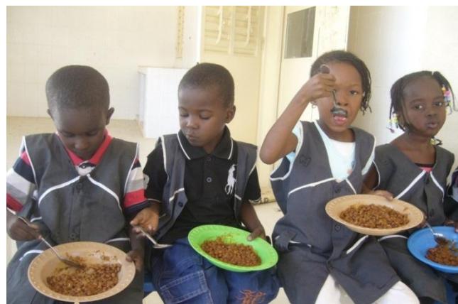
Petit repas hyper-protéiné