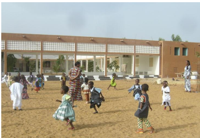
L'espace psychomotricité. Aujourd'hui : cloche pied !

Nous serons huit membres de l'association Morgane à Dagana les 9 et 10 décembre pour l'inauguration de l'école maternelle en présence des élèves, des enseignants, du personnel périscolaire, de nombreux officiels et des parents d'élèves, habitants du quartier pour qui cette école concrétise la première étape de l'avenir de leurs enfants et les espoirs qu'ils y portent.