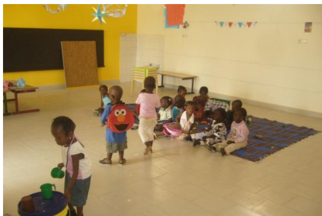
Rentrée 2011/2012 : Les petits