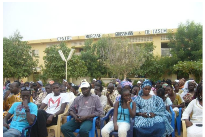
Réunion de parents d'élèves au centre Morgane