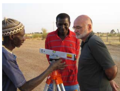
La découverte du niveau laser