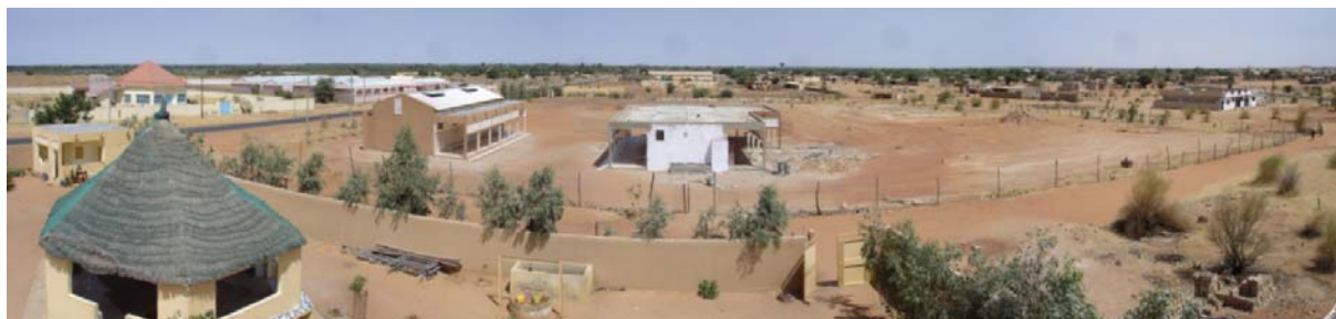
Les deux premiers modules du groupe scolaire vus du toit du centre Morgane

Les deux premiers modules font déjà un ensemble remarquable et on commence à deviner l'harmonie, l'équilibre et les volumes de l'ensemble. Les classes sont grandes, hautes de plafond, protégées du soleil par les galeries et des doubles murs, les enfants et les enseignants souffrent moins de la chaleur que dans d'autres écoles. C'est déjà un début de réussite. Il reste encore une hésitation sur l'intérêt du double toit, surtout en raison de son coût. Les mesures de températures n'ont pas encore permis d'évaluer finement les écarts entre les deux premiers modules construits, l'un avec et l'autre sans double toit, et plus généralement avec d'autres bâtiments de facture plus classique. Elles devraient pouvoir être réalisées sur les semaines qui viennent.