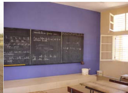
La salle bleue

Merci : Les ambitions de l'Association sont immenses, son engagement aussi en votre nom à tous. Notre espoir du moment, en légère anticipation : pouvoir démarrer la construction de l'école maternelle fin 2008 pour une ouverture d'une ou deux classes dès la rentrée d'octobre 2009...dans le rythme et la continuité. Merci de nous rejoindre.