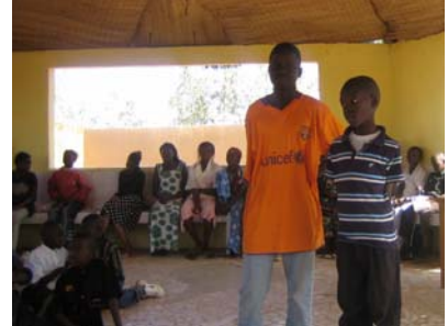
Présentations des commissions de l'école