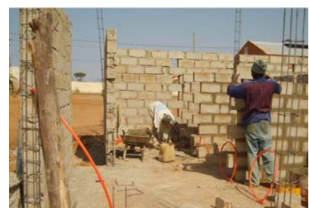
Les murs une semaine plus tard

association.morgane@numericable.fr www.association-morgane.org