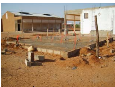
Fondation des sanitaires

Association Morgane 5, impasse de la Coudre 44300 NANTES Tél. : 02 40 50 36 42